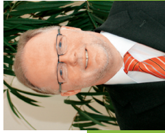
Liebe Bürgerinnen und Bürger,

mit dieser Broschüre möchten wir Ihnen die ab dem 1. Januar 2008 gültigen Fördermöglichkeiten für Privatpersonen in den Bereichen energieeffizienter Neubau, Altbausanierung, rationale Energieanwendung und Nutzung erneuerbarer Energien gemäß « Règlement grand-ducal du 21 décembre 2007 (Mémorial A - N° 247) instituant un régime d'aides pour des personnes physiques en ce qui concerne la promotion de l'utilisation rationnelle de l'énergie et la mise en valeur des énergies renouvelables » vorstellen.